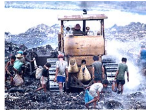
Den fattigste halvdelen av jordens befolkning mottar 3 prosent av den globale inntekten. En økning til 6 prosent er nok til å utsette alvorlig fattigdom.

Han foreslår at mediene kan hente kunnskap fra flere disipliner som statsvitenskap, økonomi og filosofi for gradvis å bygge opp en interesse blant folk.