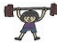
tǐ lì 体力