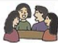
tǎo lùn 讨论