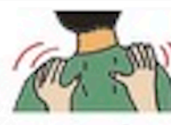
tuī ná 推拿