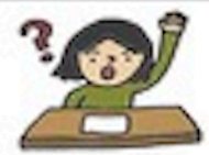
tí wèn 提问