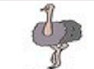
tuó niǎo 鸵鸟