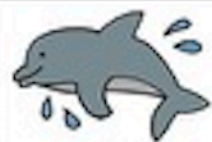
hǎi tún 海豚