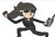
tè wù 特务