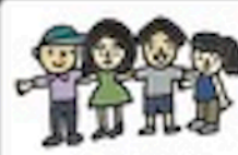
tuán tǐ 团体