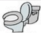
mǎ tǒng 马桶