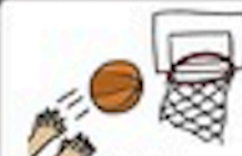
tóu lán 投篮