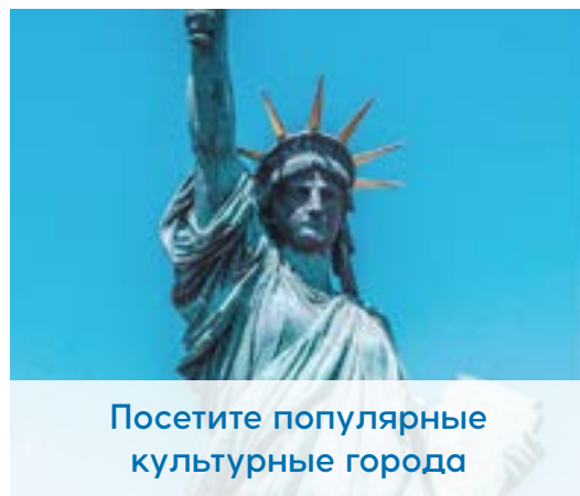
Посетите популярные культурные города